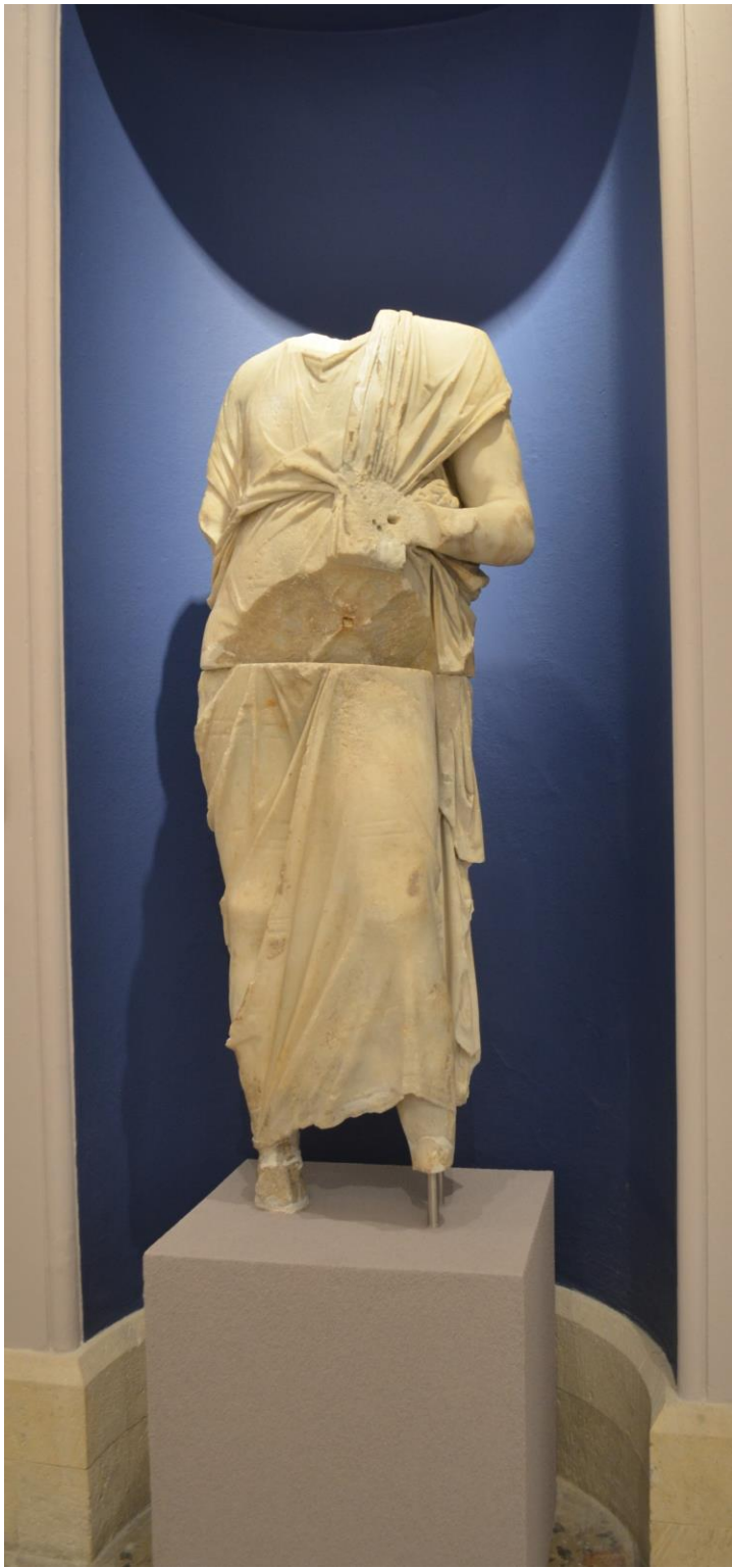
Ακέφαλο άγαλμα ανδρικής μορφής με χιτώνα και ιμάτιο. Βρέθηκε στο ρωμαϊκό Ωδείο. Μετά το 150 π.Χ.