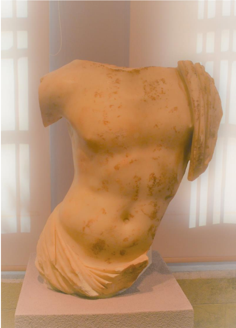
Γυμνός κορμός ανδρικού αγάλματος, με μάρτιο γύρω από την μέση και τον αριστερό ώμο. Βρέθηκε στο ρωμαϊκό Ωδείο. Γύρω στο 180/170 π.Χ.